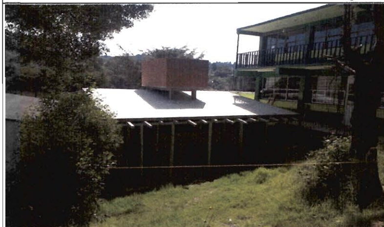
Fotografías de la Obra