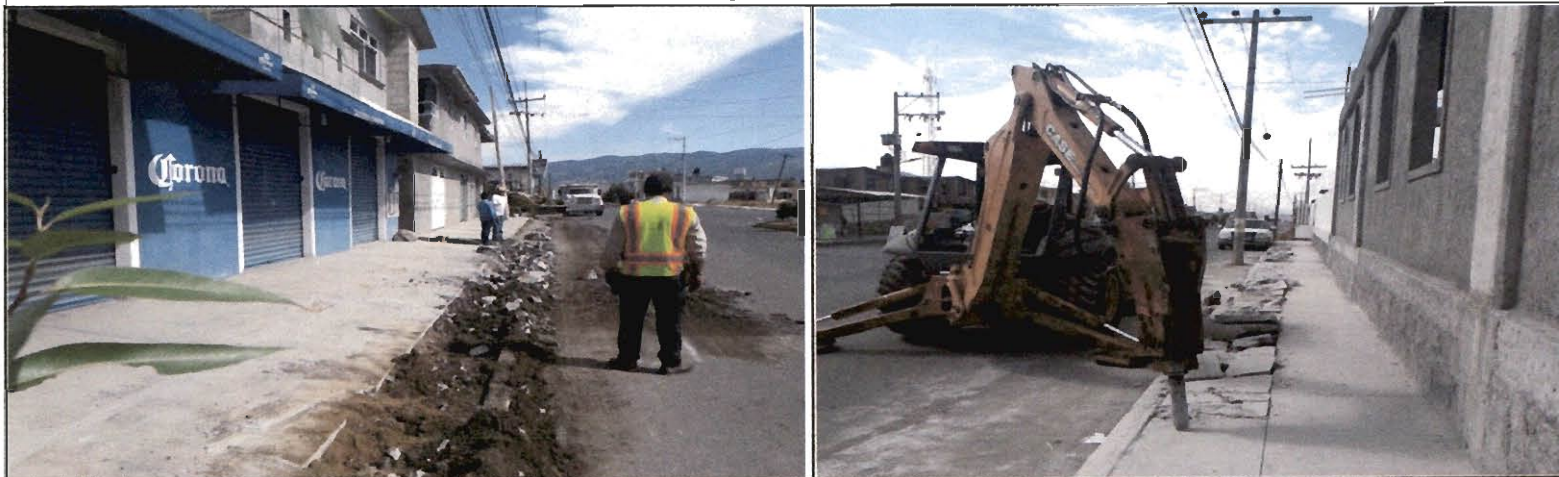
Fotografías de la Obra